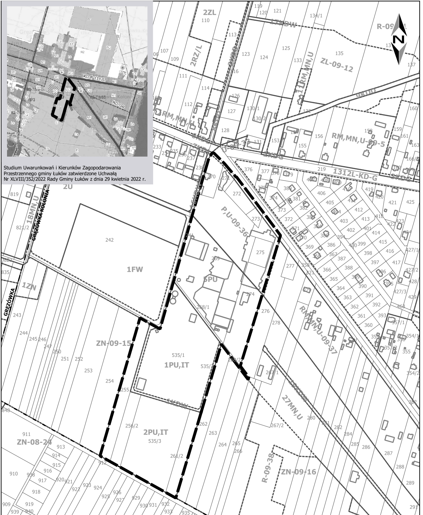
Studium Uwarunkowań i Kierunków Zagospodarowania Przestrzennego gminy Łuków zatwierdzone Uchwałą Nr XLVIII/352/2022 Rady Gminy Łuków z dnia 29 kwietnia 2022 r.