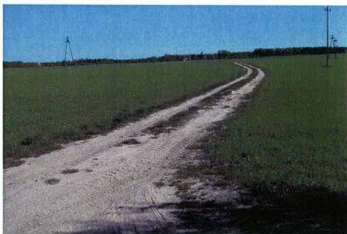
Droga dojazdowa do pól Nr 861