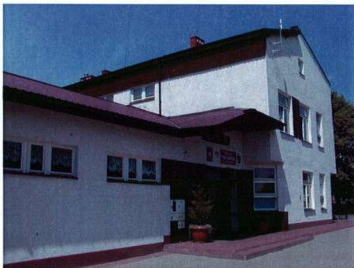
Szkoła Podstawowa w Aleksandrowie

Obecnie szkoła jest nowoczesna, dobrze wyposażona w nowy sprzęt i pomoce dydaktyczne oraz zapewnia wysoki poziom nauczania. Dysponuje obecnie 6-cioma salami lekcyjnymi, pracownią komputerową z 10-cioma stanowiskami podłączonymi do Internetu, salą gimnastyczną, biblioteką szkolną, świetlicą, kuchnią oraz kompleksem oddziału przedszkolnego. Szkole brakuje jedynie boisk.