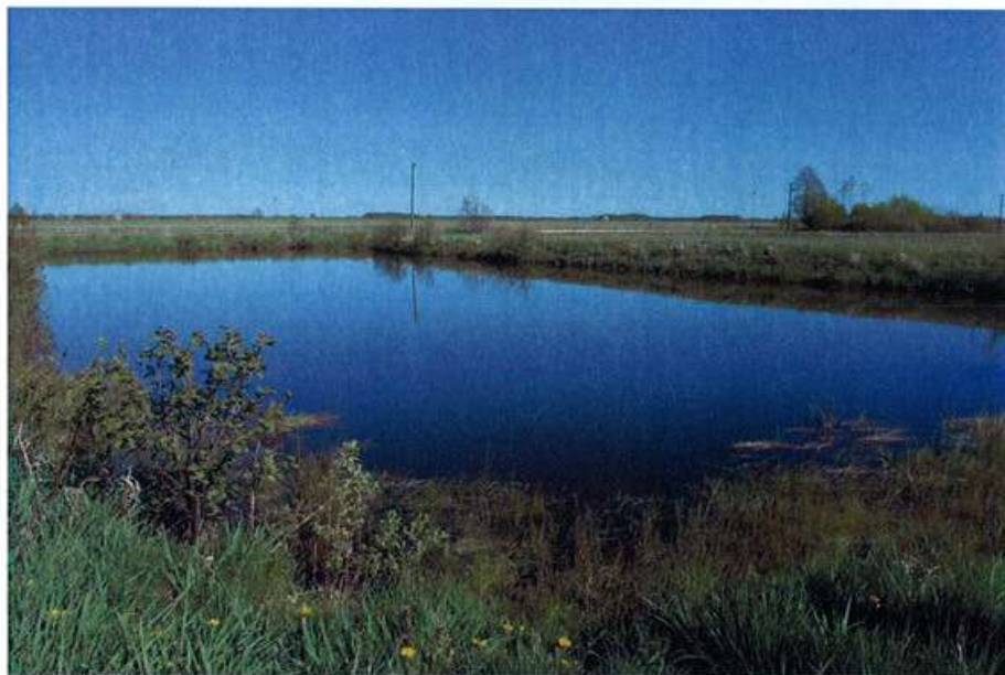
Jeden ze stawów hodowlano – rekreacyjnych