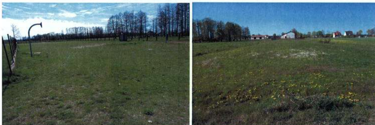
Działki pod budowę boisk.